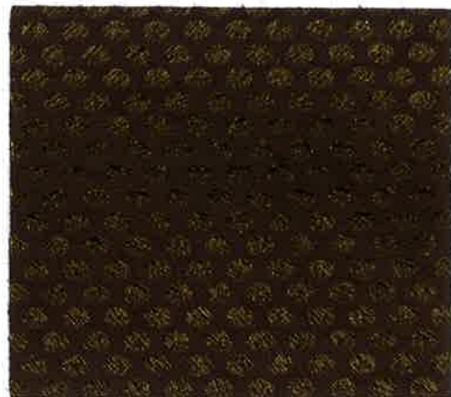
品番 SK 30016/1011