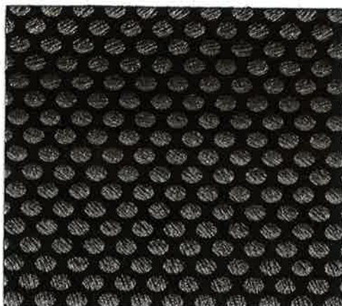
品番 SK 30016/1000