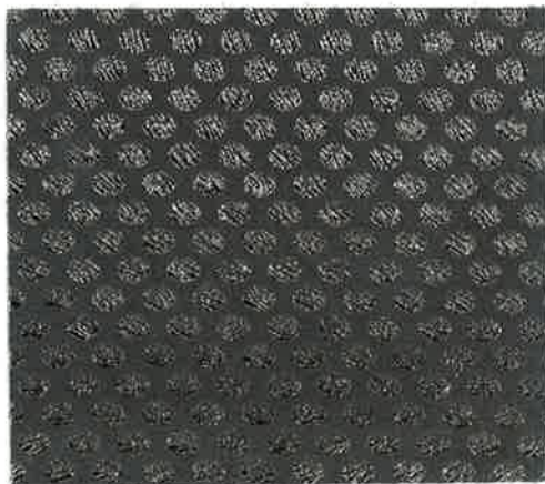
品番 SK 30016/930

色の組み合わせで、オリジナルなカラー提案が可能です。ご注文は、一枚からお請け致します。