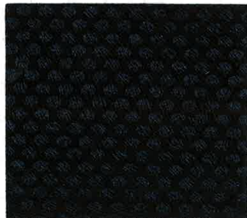
品番 SK 30016/1000・ネイビー